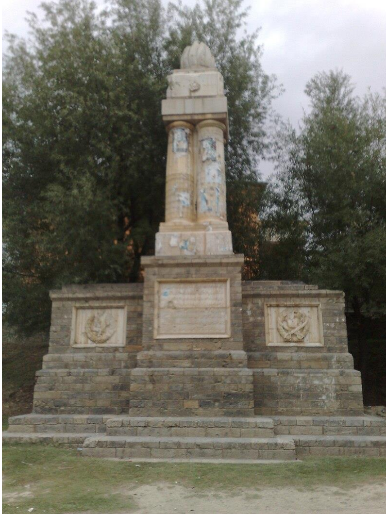
تصویری از بنای یادبود (مانومنت) در ولسوالی پغمان