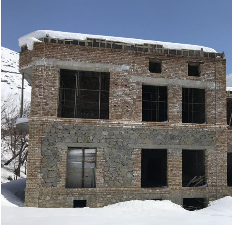
تصویری از قصر حرمسرا در جریان ساختمان