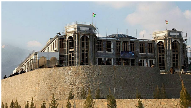
تصویری از قصر مرمین تپه پغمان

درهٔ پغمان در میان خود دو درهٔ کوچک دارد. نام یکی از آن‌ها درهٔ راست و دیگری درهٔ چپ است. دریای کابل از همین درهٔ پغمان سر چشمه می‌گیرد که در کتاب‌ها بنام درهٔ اونی پغمان ذکر شده‌است. در مرکز پغمان به فاصلهٔ سه (۳) کیلومتر دورتر، جوار قلعهٔ شیخ میر یک تپه قرار دارد که از آن تپه به نام تپهٔ پغمان یاد می‌شود و یک جای زیبا و تفریگاه فامیلی برای افغان‌هاست که در سال ۱۳۹۲ قصر مرمین بالای این تپه اعمار گردید تا جشن نوروز ۱۳۹۳ با اشتراک مهمانان زیادی از کشورهای حوزهٔ نوروز درین محل تجلیل گردد اما متأسفانه نظر به دلایل امنیتی در ارگ ریاست جمهوری برگزار گردید. (۱)