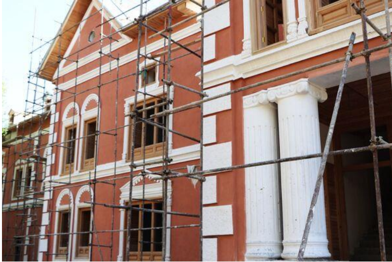
تصویری از قصر حرمسرا در بالاباغ پغمان