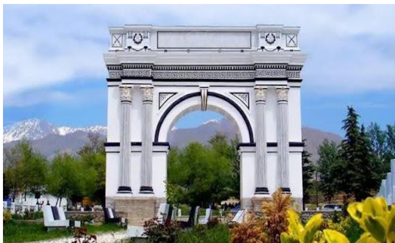
تصویری از تاق ظفر ولسوالی پغمان