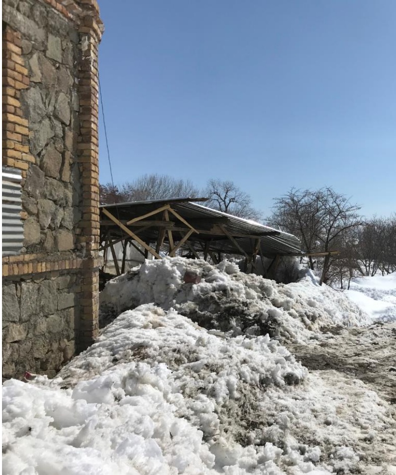
تصویری از قصر حرمسرا در جریان باز ساختمان