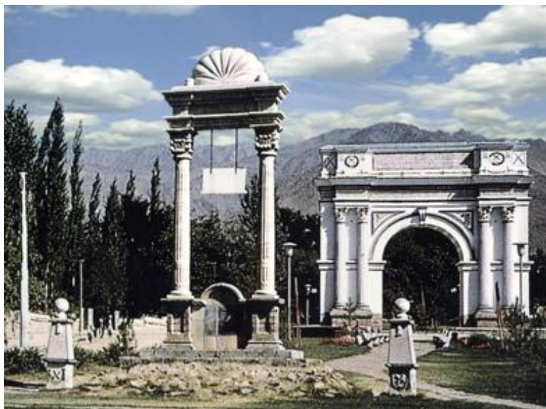
تصویری از تاق ظفر ولسوالی پغمان