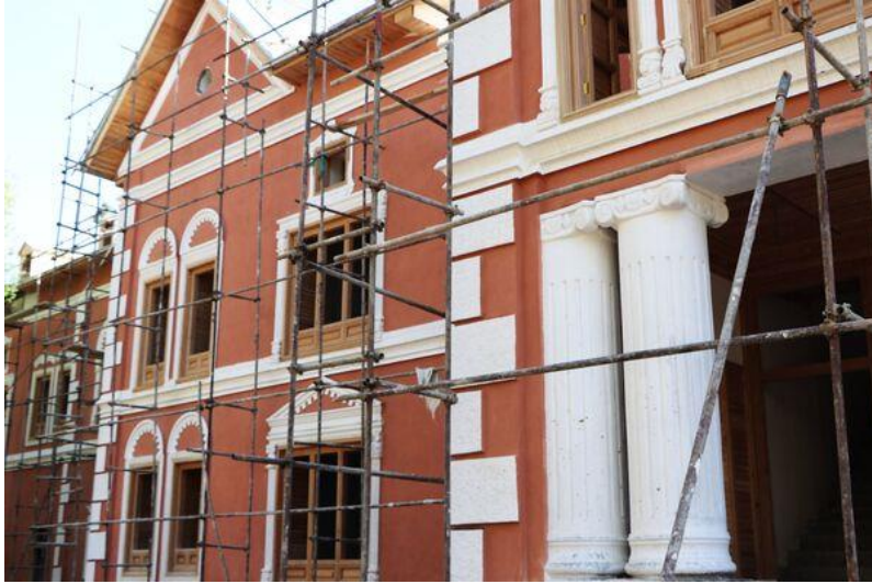
تصویری از قصر حرمسرا در بالاباغ پغمان