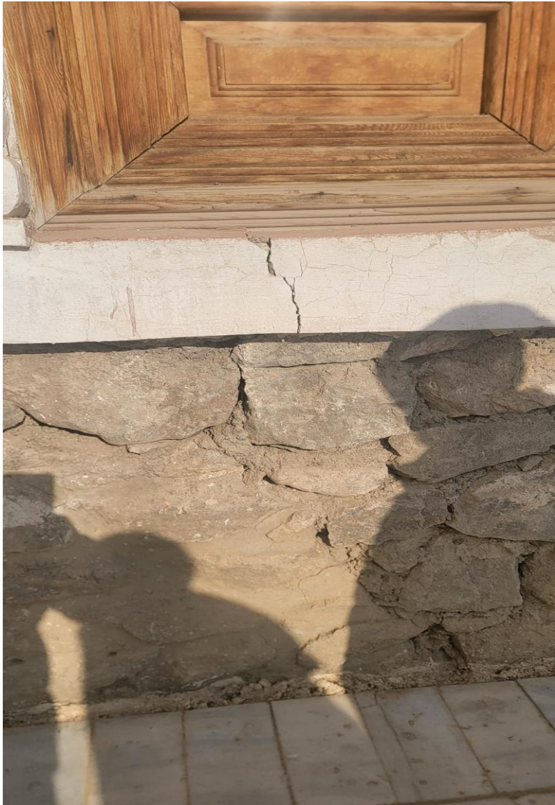
تصویری از ترک (درز) عمودی در ساختمان حرمسرا