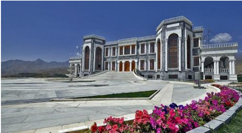
تصویری از قصر مرمین تپه پغمان

ناگفته نباید گذاشت که در فصل های بهار و تابستان خصوصاً جمعه ها مردم زیاد کابل و ولایات برای میله به این مناطق زیبا می روند. نکته ای که باید خاطر نشان کرد این است که اکثراً مردم کابل و ولایات برای میله (گردشگری) به دره پغمان می روند اما قریه هایی