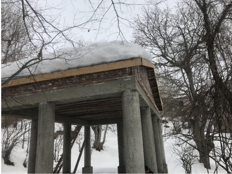
تصویری از چوب تره مستطیلی واقع بالا باغ پغمان