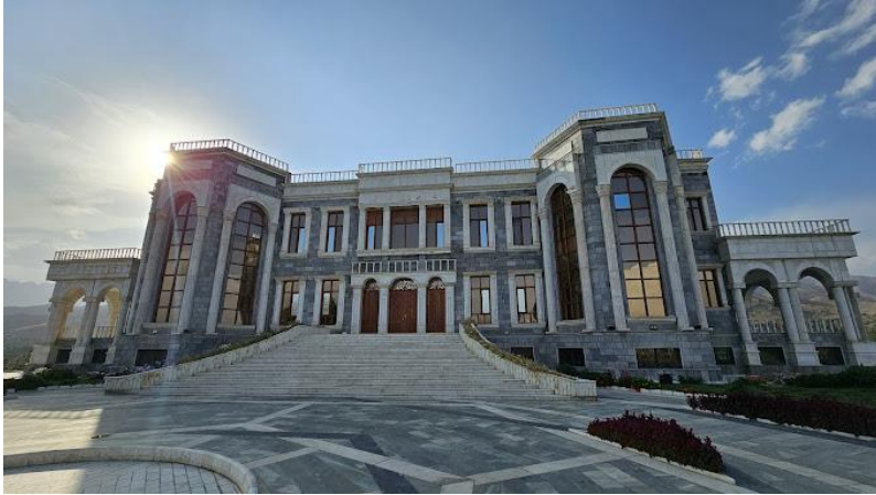
تصویری از قصر مرمین تپه پغمان