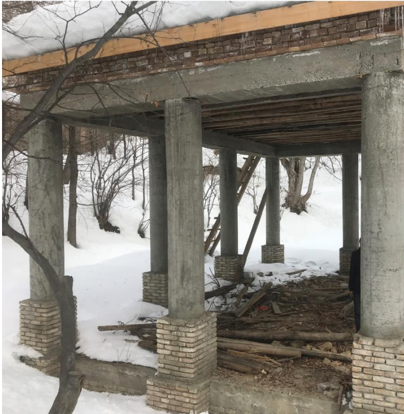
تصویری از چوب تره مستطیلی واقع بالا باغ پغمان