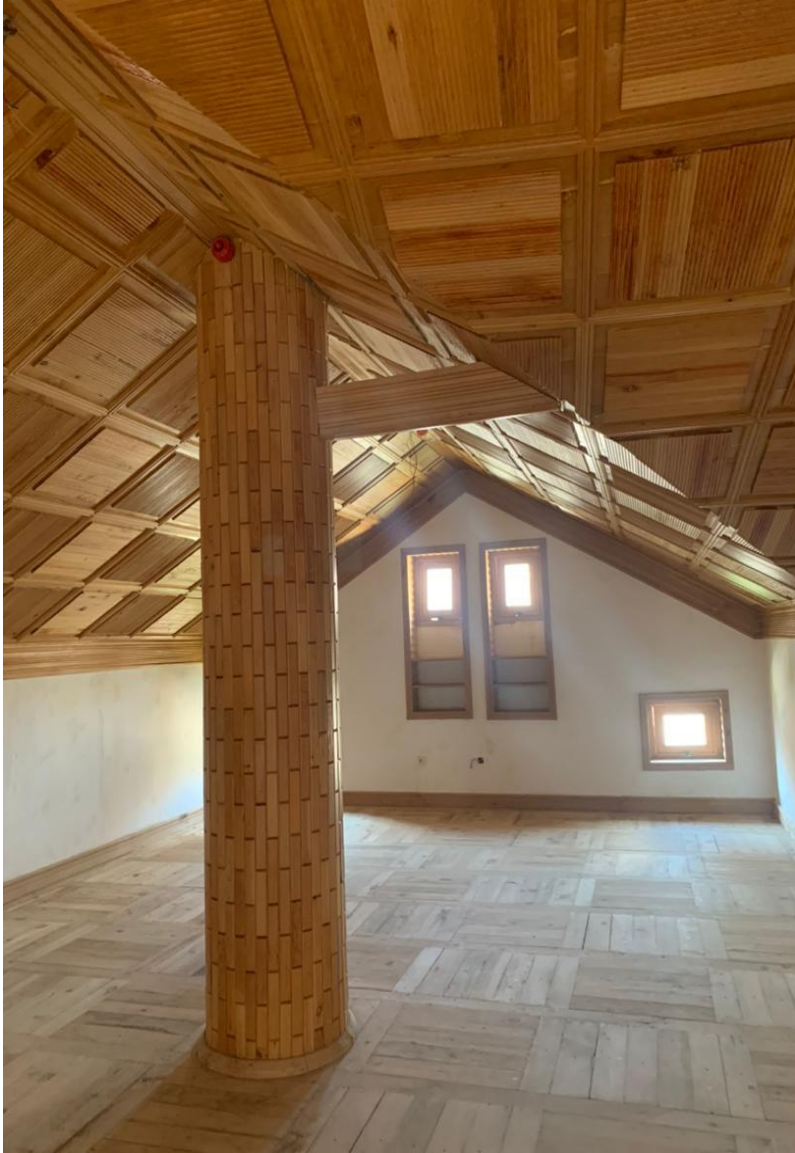
تصویری از ساختمان داخلی حمام و تشناب