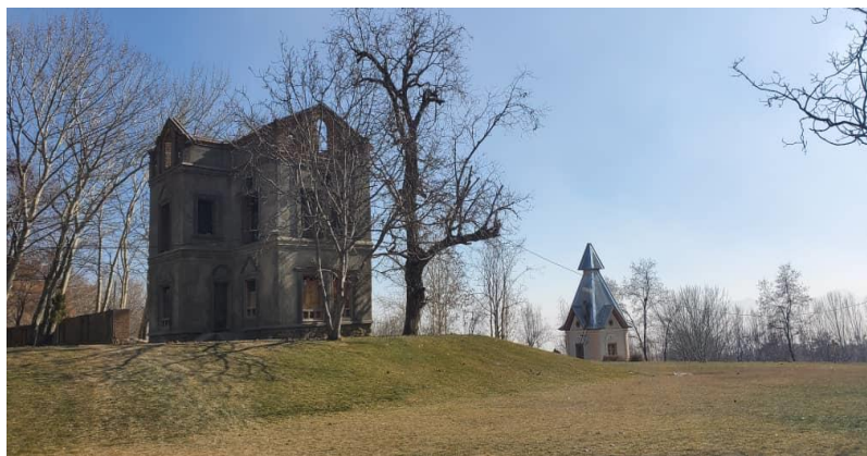
تصویری از قصر تاجدار در بالاباغ پغمان

با گذشت بیش یک ساعت از شروع آتش سوزی تیم آتش نشانی به محل نرسیده و مردم تلاش می کنند آتش سوزی را مهار کنند. این شهروند گفت که این بنای تاریخی به طور کامل در آتش سوخت. « (۴)