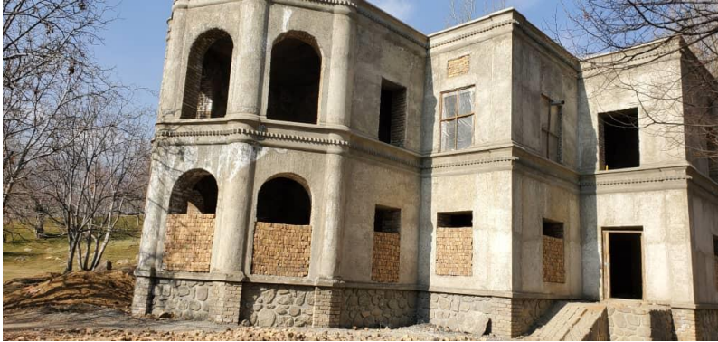
تصویری از جریان کار باز سازی بالا باغ پغمان