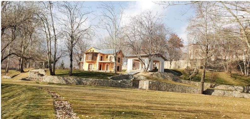
تصویری از پایان کار باز سازی بالا باغ پغمان