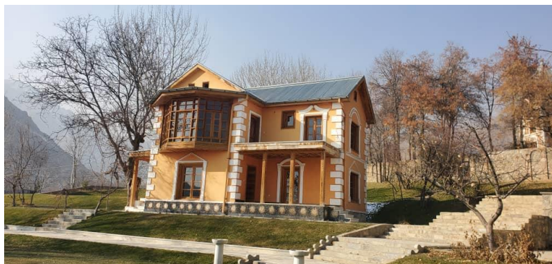
تصویری از پایان کار بازسازی بالا باغ پغمان