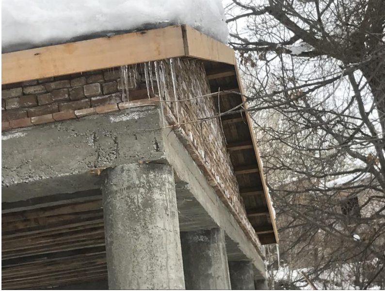
تصویری از چوب تره مستطیلی واقع بالا باغ پغمان