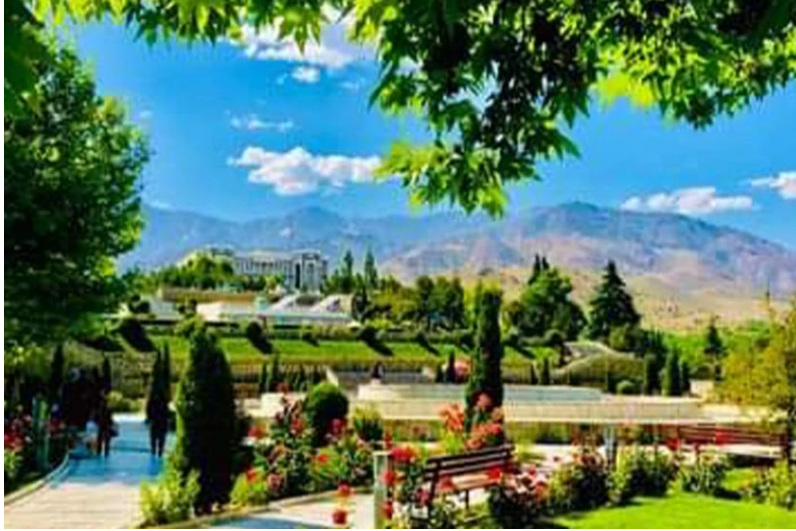
تصویری از تپه پغمان