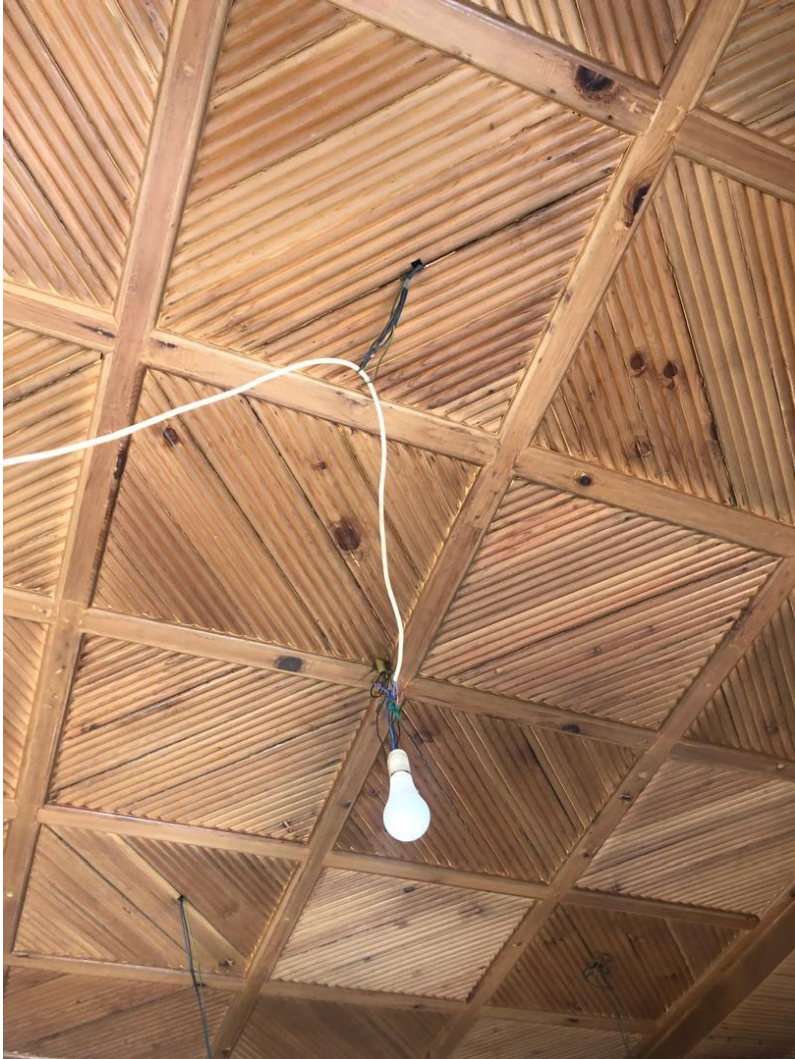
تصویری از مسطح سقف داخلی قصر تاجدار در بالاباغ پغمان