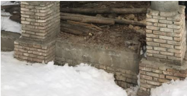
تصویری از چوب تره مستطیلی واقع بالا باغ پغمان