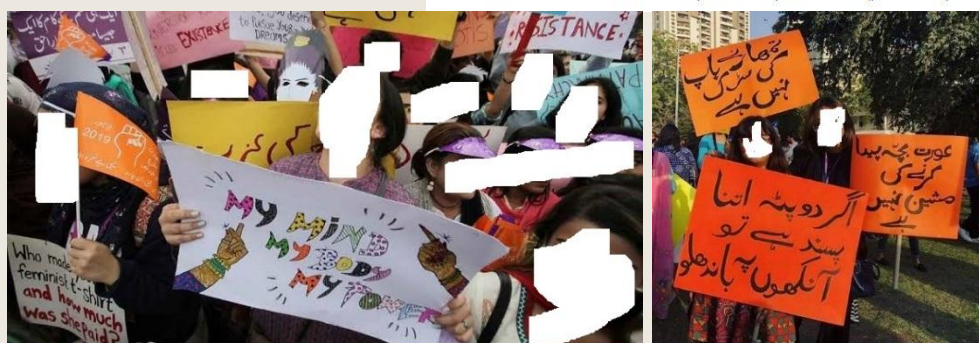
پاکستاني محصيليني د حجاب ضد مظاهره

نو په پورته ډول سیکولر تعلیم په اسلامي امت کې د سیکولر ټولنيز او کفري ژوند لپاره متضمن گرځېدلی چې مونږ يې له شر څخه الله سبحانه و تعالی ته پناه وړو، پدې تعلیم کې د سیکولر ټولنيز ژوند نور اړخونه هم لکه سیکولر آزادیاڼې، کفري