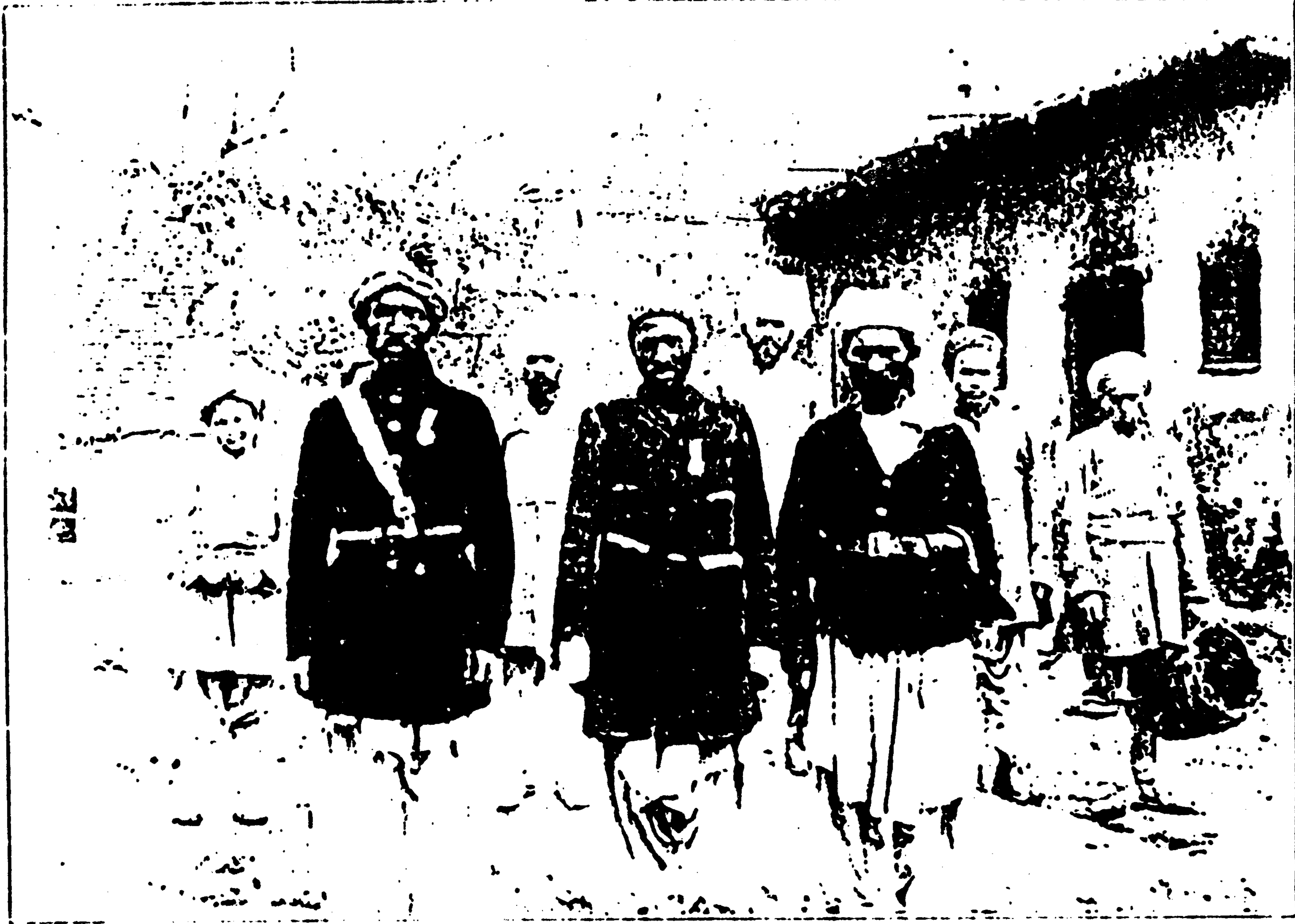
د مولف په کورکي دافغاني ساتونکو او نوکرانودله - پخلنځی یې شاته دی