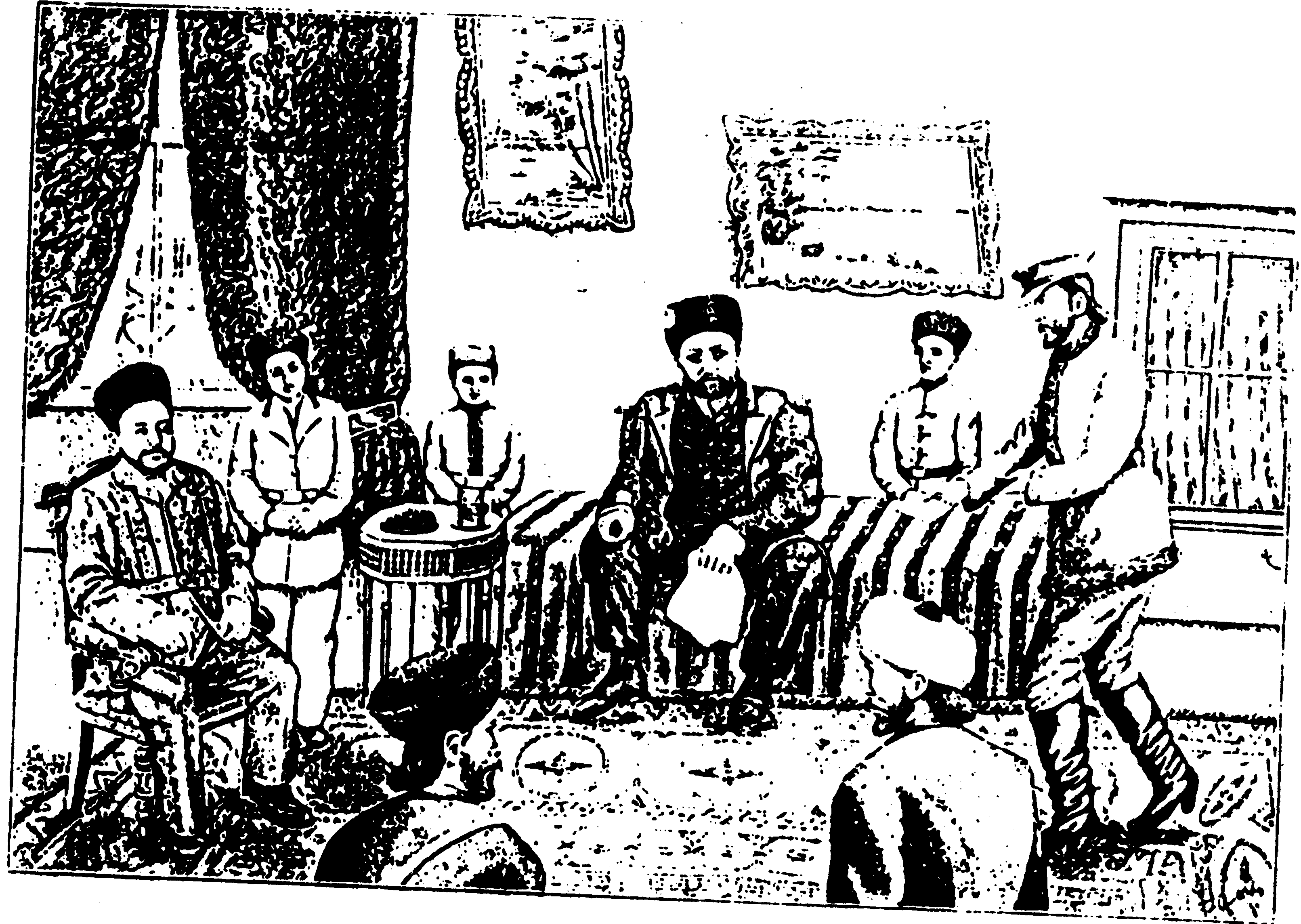
امير عبدالرحمان په ورخني دربار كي - سردار حبيب الله هم ورسره ناست دي . ( دمولف رسامي )