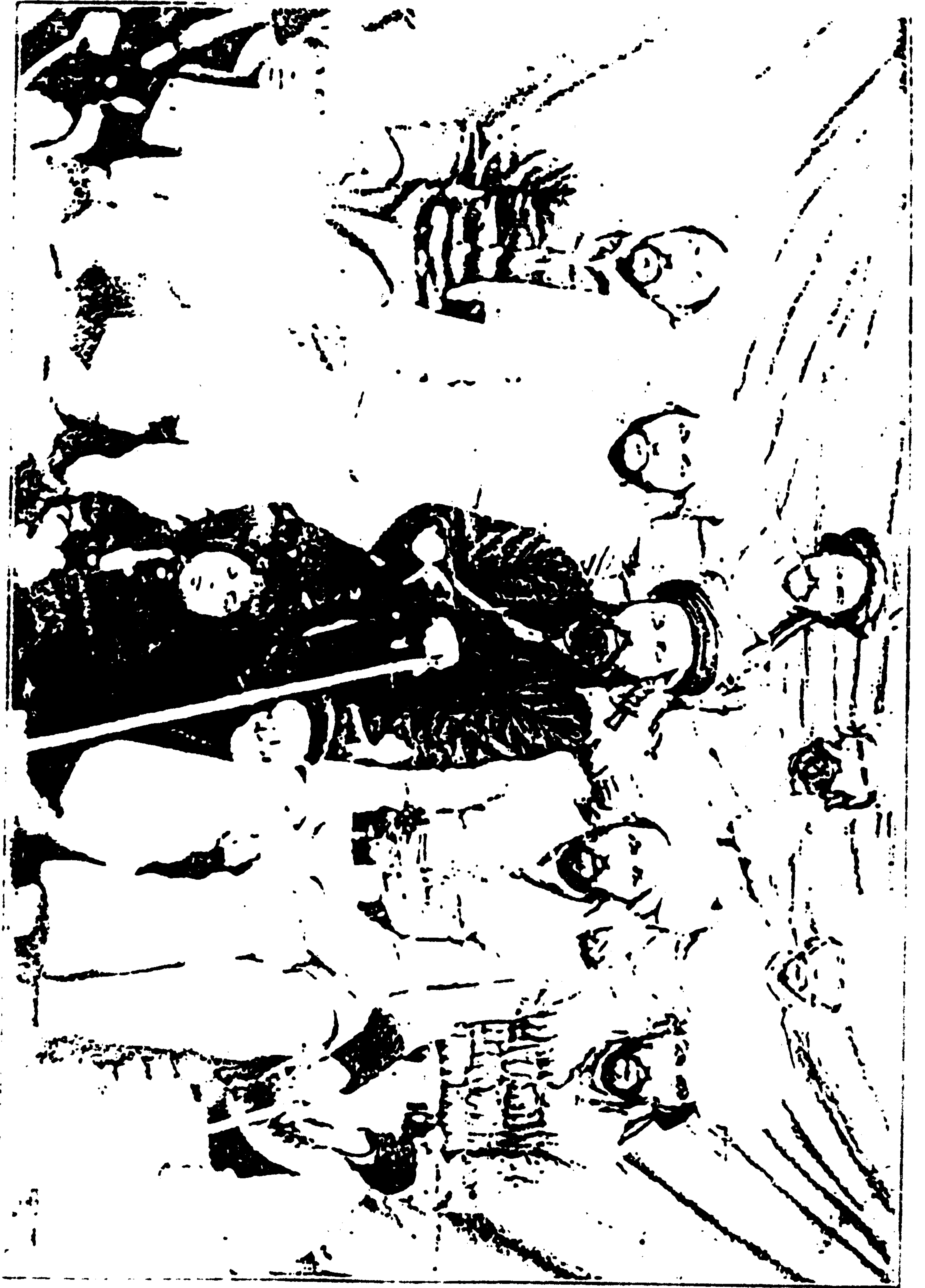
د کابل میزایانو یوه وده