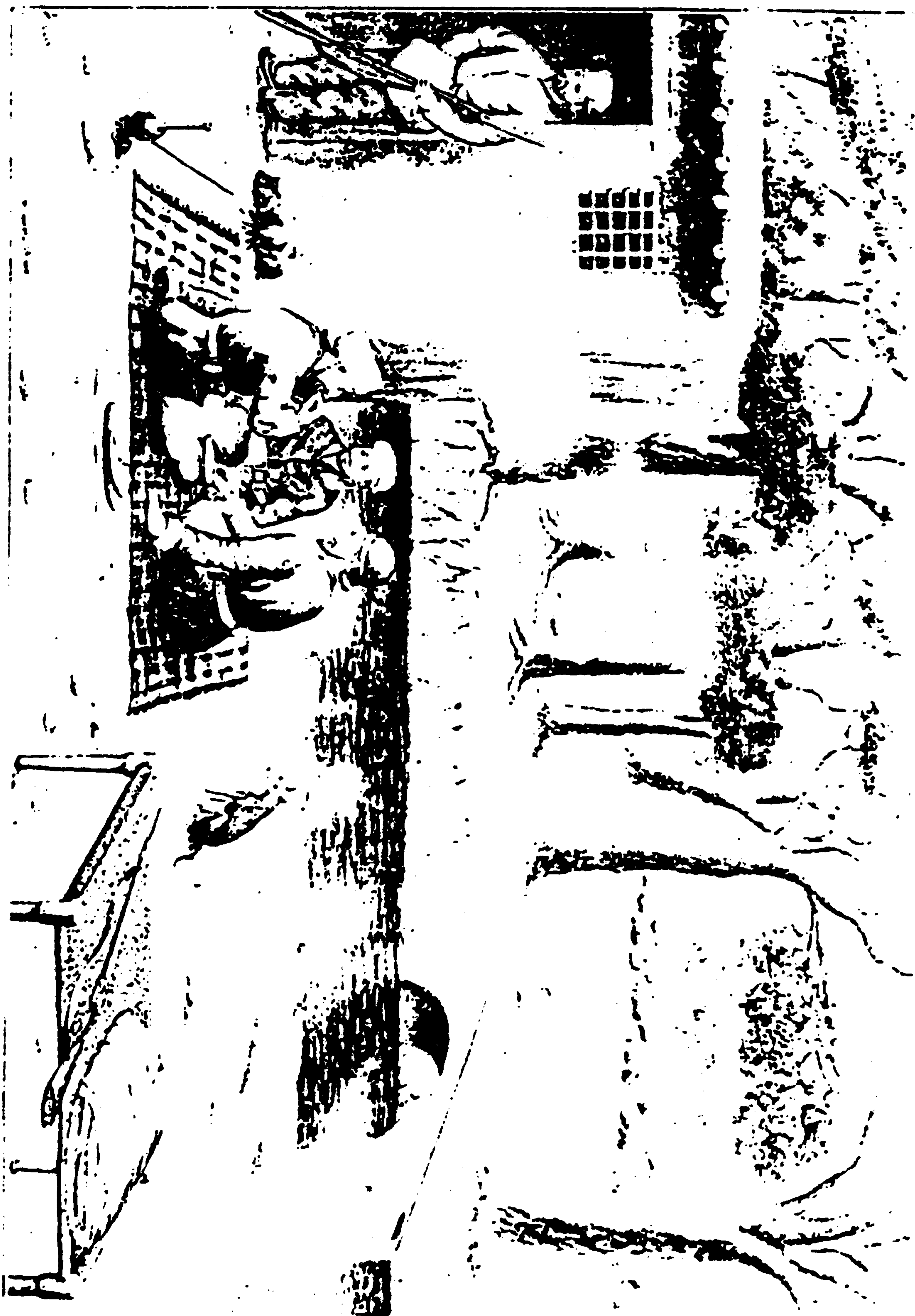
د کابل ورکشاپونز په باغچه کې عسکر د پیری او د ودی خور لویه حال کې ( د مورلف رسامی )