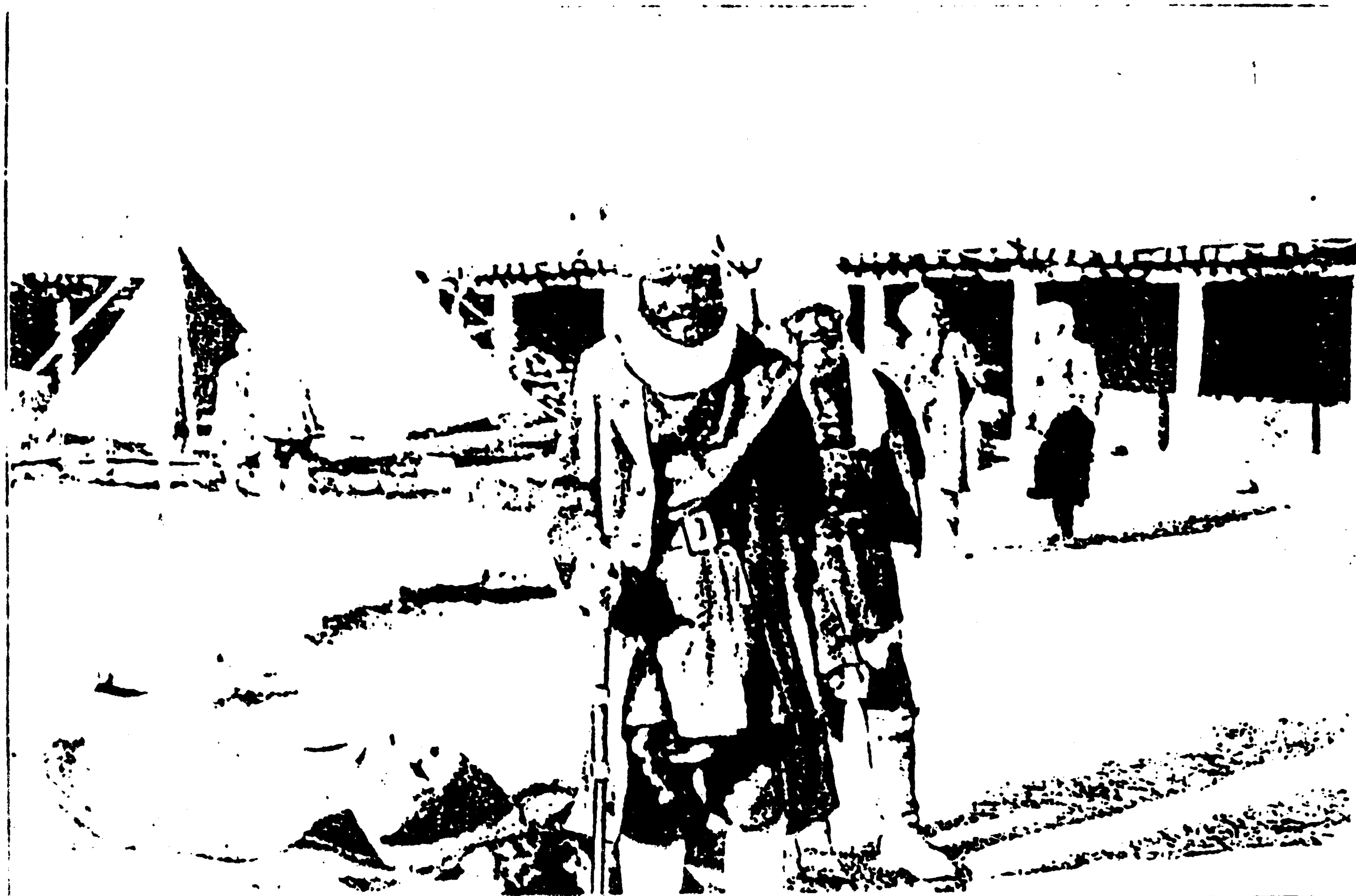
د کابل او پېښور پر لار کاروانسرای