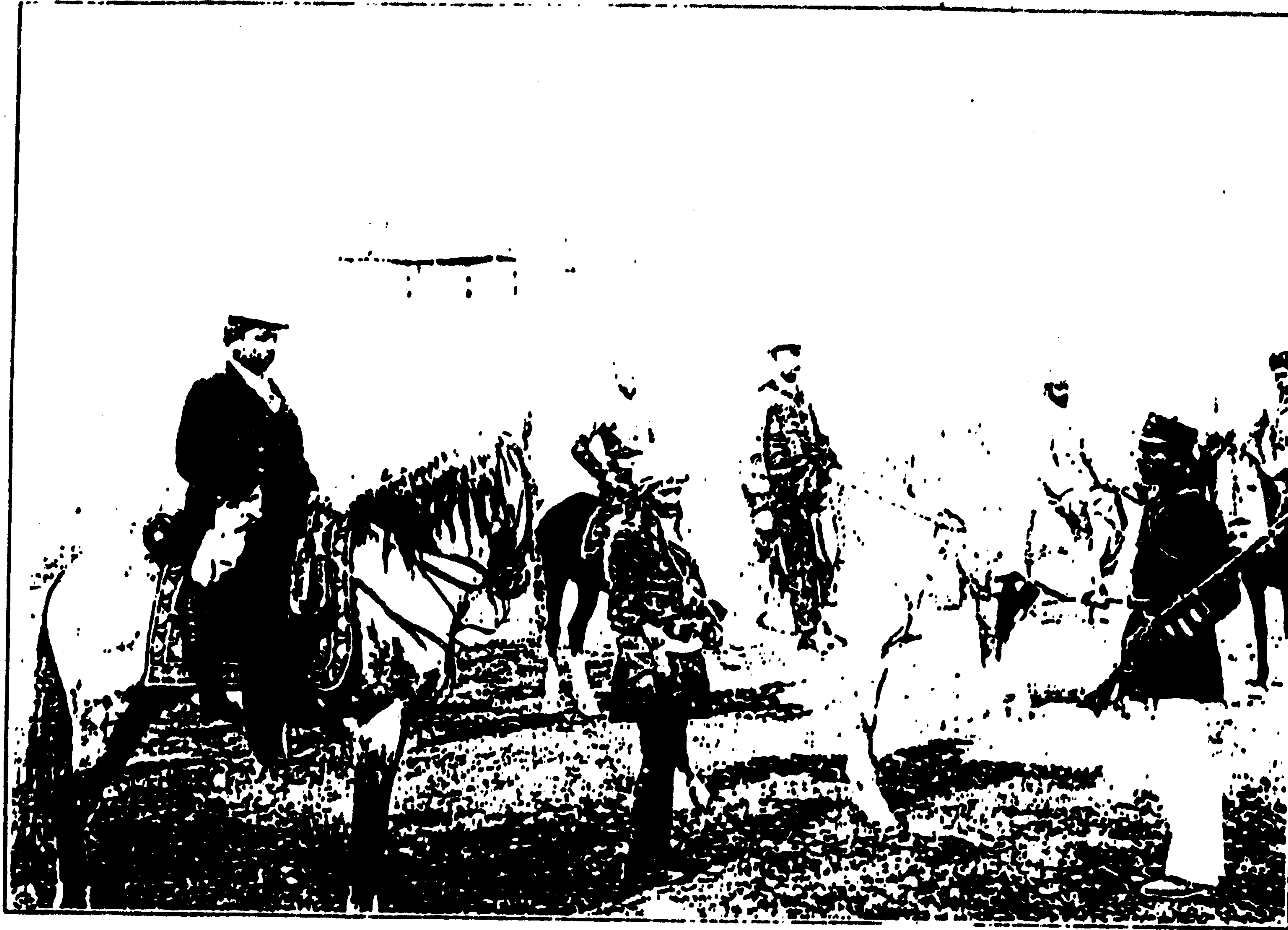
سردار محمد عمر خان او عملہ یی