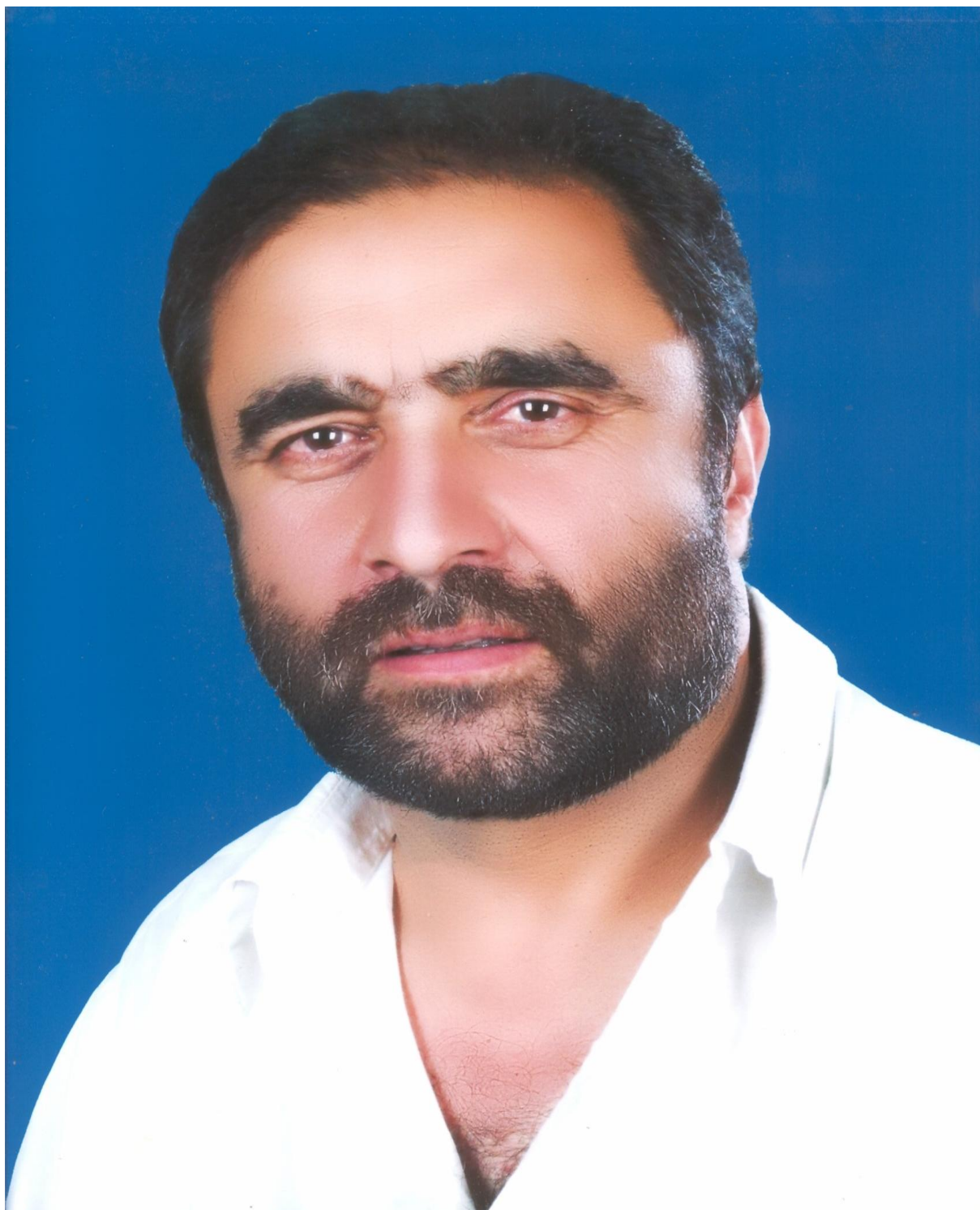
لايق زاده لايق