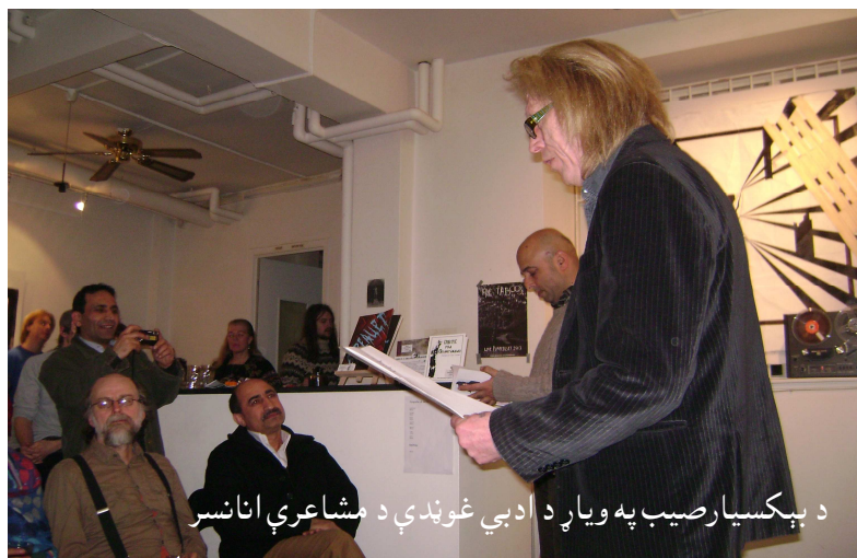
د بېکسيار صيب په وياړ د ادبي غونډې د مشاعرې انانسر

څوک راغی، انانس يې ورکړ، ويل يې دا ځای تنگ دی، پاس پورته ځو، ټول هلته لاړو، هغه ځای نسبتاً مناسب او د ناستې ځای و، څو شپبو کې شاعران راټول شول، ډنمارکي شاعران هم په کې وو، له اروپايي هېوادونو څخه ځينې نور راغلي افغانان هم په کې وو، د ټولو شمېر به د (۳۵-۴۰) کسانو په شاوخوا کې وو. څو شپبو کې محفل شروع شو. څو ډنمارکي، غالباً چې شاعرانې به هم وې، هلته په ډېرې بې تفاوتۍ پر ځمکه کېناستې، سگرتې يې هم څکول او کومه خاصه سليقه يې هم نه لرله، ډېرې ساده پر ځمکه کېناستې. انانس يې يو ډير خريلی، د سرو او ږدو وينبتانو څښتن و. ډېره ساده او بسيط معلومېده، نه يې نکتيایي لرله او نه هم لوکسه دريشي، بس نو لکه چې د شاعرانو عامه خاصه ده، د بد سليقې پرې تمامه وه. هغه راغی په ډنمارکي ژبه يې بڼه راغلاست ووايه او د نن ورځې د غونډې موخه يې تشریح کړه. هېواد دوست صيب هم پر دې وخت د غونډې پر جوړښت رڼا واچوله. ډنمارکي