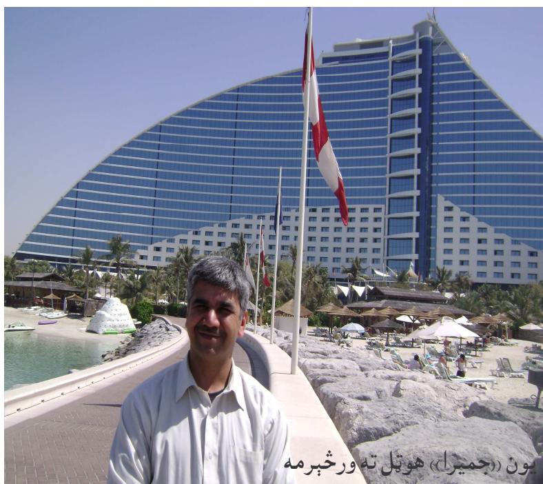
يون «جميرا» هوتېل ته ورڅېرمه