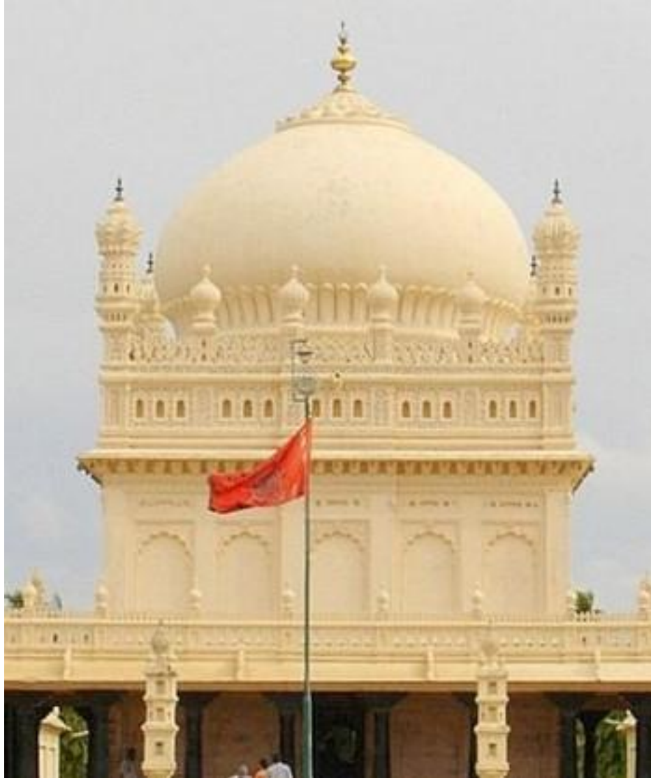
د نیو مقبره