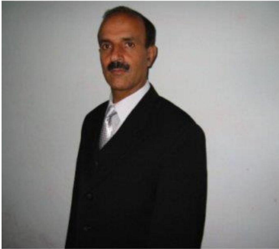
احمدشاه (په پهلوي) د الاهي ارشاداتو مفسر د پښتو د ادبي تاريخ سپاهي شاعر، ليکوال او نقد گير