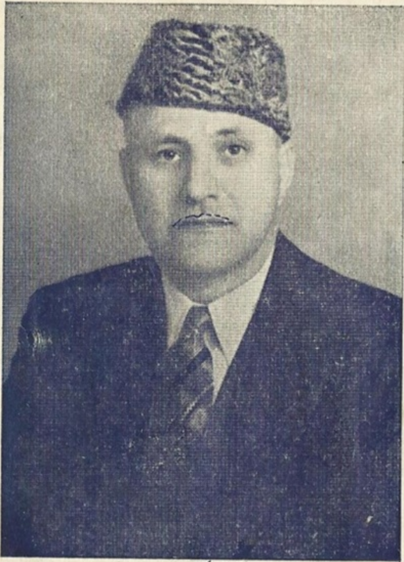
غازی ملت حکمران سوات

(گر قبول افتد ز ہی عز و شرف) فیضان عقی عنہ (سید و شریف)