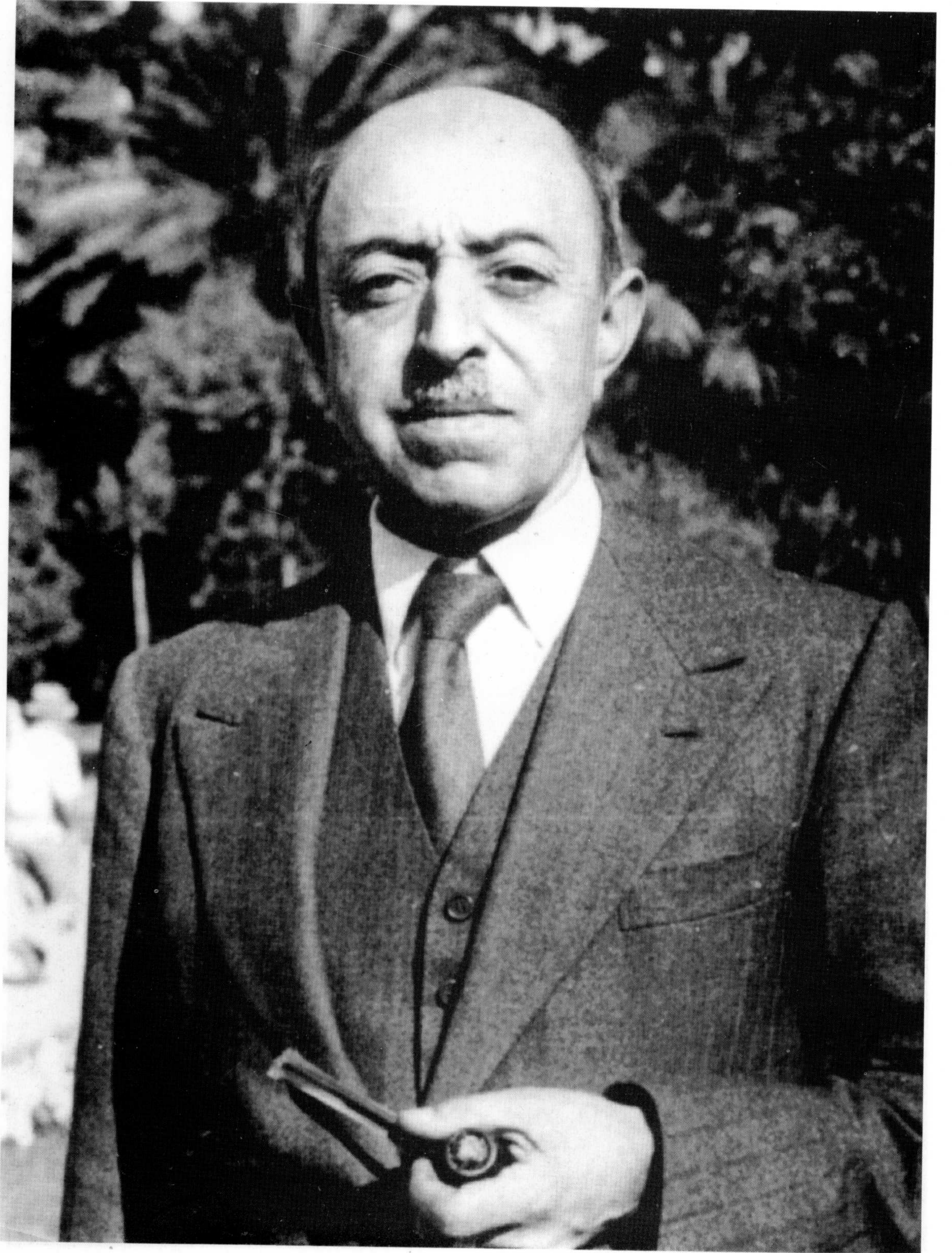
پاچان امان اللہ خان پہ روم (ایتھالیا) کھی