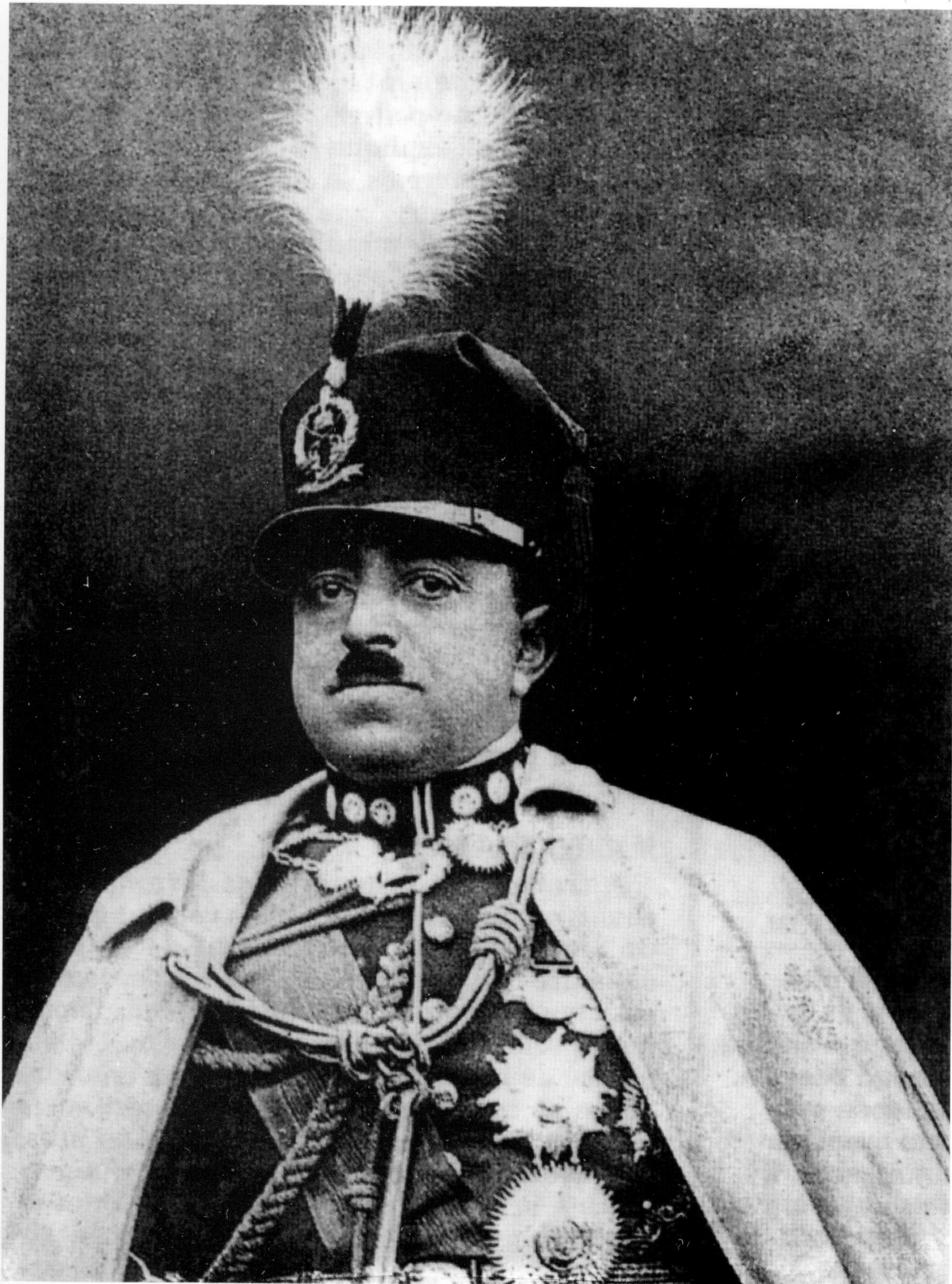
امير امان الله خان په فرانسه کې