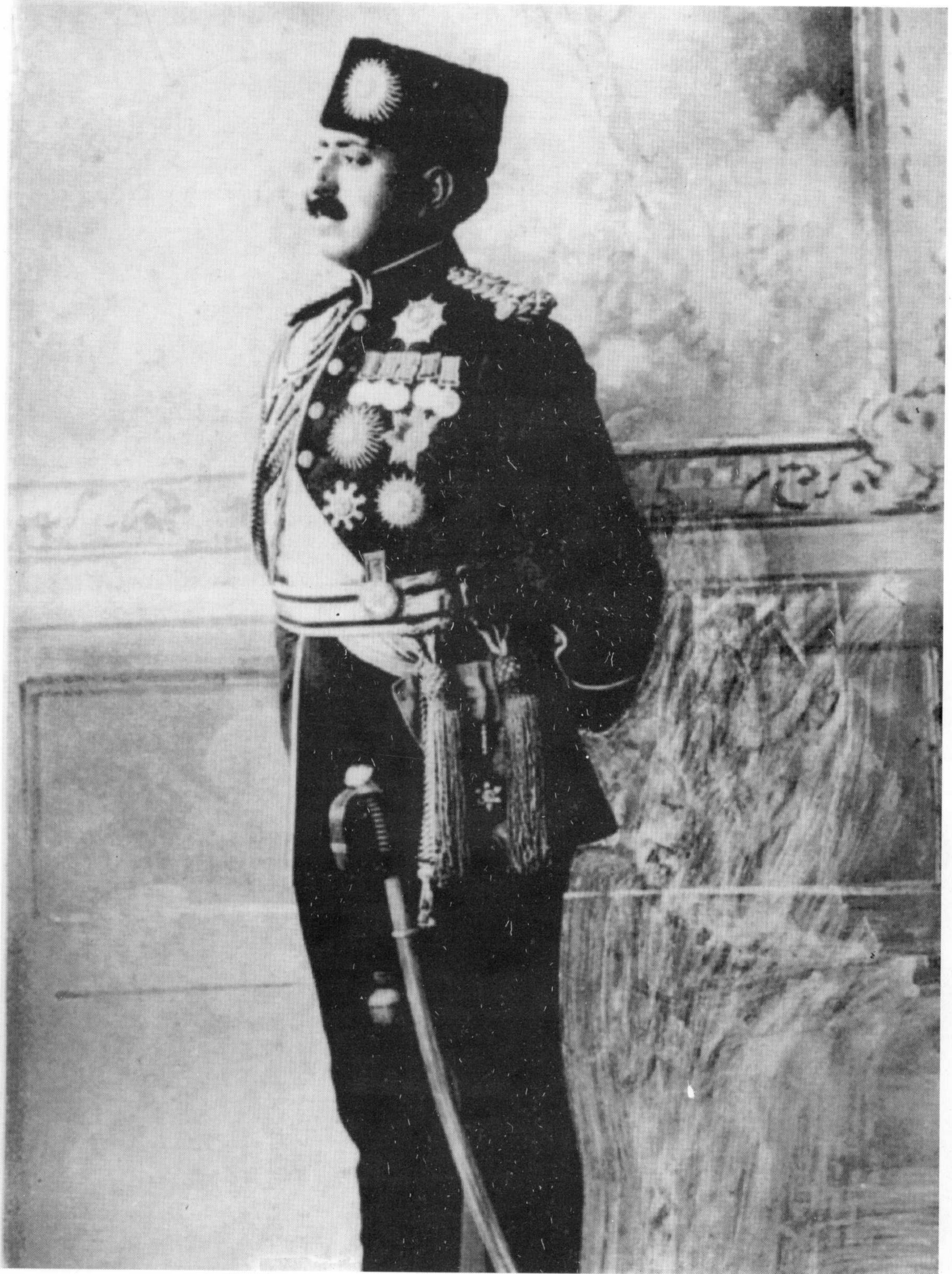
امير امان الله خان