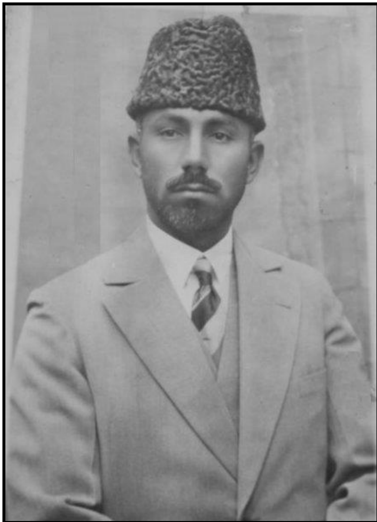
جنرال وزیر محمد گل خان مومند