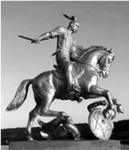
د خزري عسکر د شپږ مخيز ستوري نښان چې د اوسني اسرئيلو د بيرغ نښه هم ده.

خزران نه يوازې يهوديان شول، بلکې يو شمير يې عيسويان شول او ډير لږ شمير يې مسلمانان هم شول. هغوی دين د خپلو عقيدو لپاره انتخاب کړی نه وو، بلکې اصلي هدف يې په نړۍ کې سياسي نفوذ وو. د يهودو دين په دولسو اسرئيلي قبيلو پورې تړاو لري او غير اسرئيلي نژادونه يې دې دين ته نشي داخليدلی. همدا لامل دی چې آرتو کوستلر د خزر يهوديان په يهوديت کې ديارلسمه قبيله گڼي.