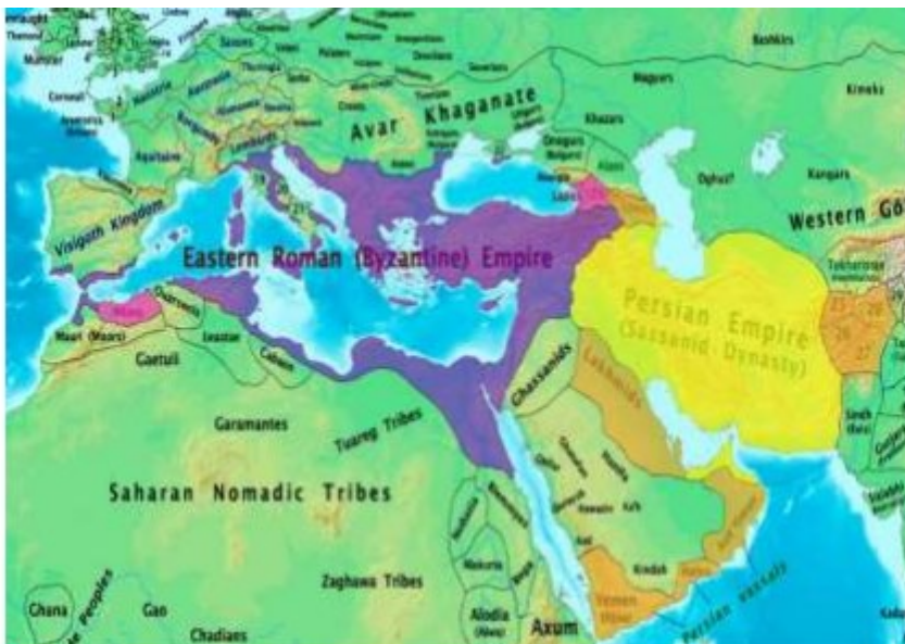
د اسلام تر راتگ وړاندې د ۶۰۰ م کال نقشه

اسلام د پوره دين په توگه د ټول بشریت لپاره د خونې يو زيری شو او د نړۍ له اوسني بحراني حالت څخه د راوتلو لپاره د نړۍ د خالق له لوري را واستول شو. د اسلام لارښوونې پداسې حال کې چې د عيسی عليه السلام د محبت، گډ ژوندانه، صبر، ملگرتيا، ورورلی او سولې څخه برخمنې دي، د موسی عليه السلام په څير د بې عدالتۍ په وړاندې د سختې مبارزې او مقاومت ټينگار هم کوي. اسلام يو علمي، عملي، څو بُعدي، پوره او هر اړخيز دين دی چې لارښوونې يې د بشري ژوندانه ټول اړخونه، زاويې او ابعاد په بڼې طريقې سره تر څيرنې لاندې نيولی دي. انسان يې له ټولنې څخه د يوازې کيدو ژغورلی دی، بې عدالتی يې د هر انسان په وړاندې (که