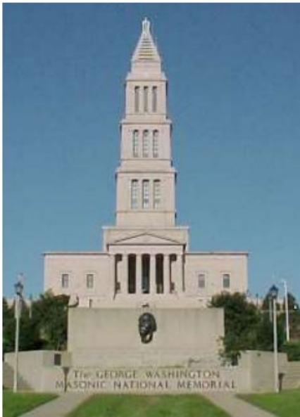
د ميسنانو په واسطه د جورج واشنگټن د يادگار ميسني ودانۍ

فريميسنانو په فرانسې اکتفا ونکړه او په ټوله اروپا او نړۍ کې د خپلو نظريو د پراختيا او خپراوي غوښتونکي وو. کرن لوييس ليکي: د نولسمې پېړۍ په لومړيو کې هسپانوي