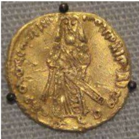
د اموریانو په واسطه جوړه شوې سکه

د یزید تر حکومت وروسته، نظام په شکل د اشکالو په یو شاهي حکومت بدل شو. د